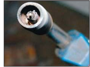
„Black & Clean“ Nozul