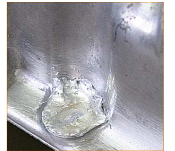
4. Yavaşca soğumaya bırakınız.