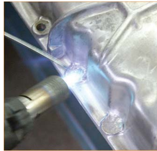
2.AL 400 'yü ısıttığınız yüzeye değdirince erimesi gerekir.